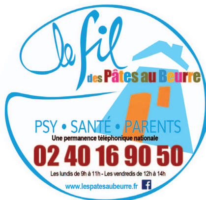
illustration : sibhan gately 2021 - sgately.com / impression : Imprimerie Parenthèses